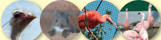
ダチョウ ニホンリス ショウジョウトキ チリーフラミンゴ