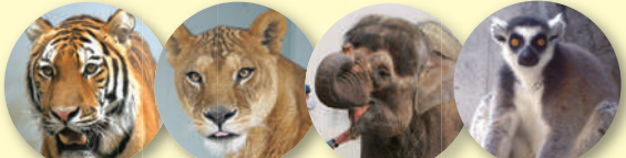
アムールトラ ライオン ボルネオゾウ ワオキツネサル