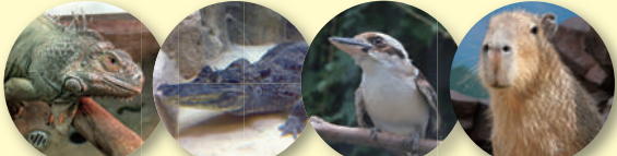
グリーンイグアナ メガネカイマン ワライカワセミ カピバラ