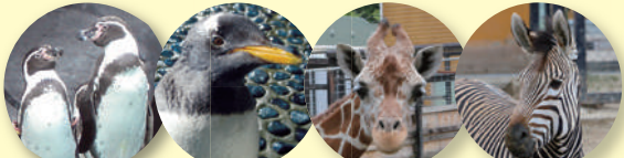
フンボルトペンギン ジェンツーペンギン アミメキリン ハートマンヤマシマウマ