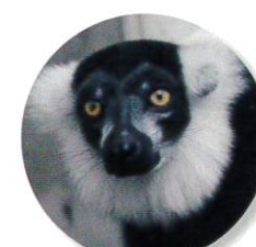
エリマキキツネザル