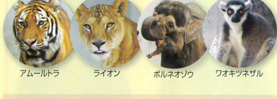
⑦猛獣ゾーン ⑧ゾウ ⑨サルゾーン アムールトラ ライオン ホルネオゾウ ワオキツネガル