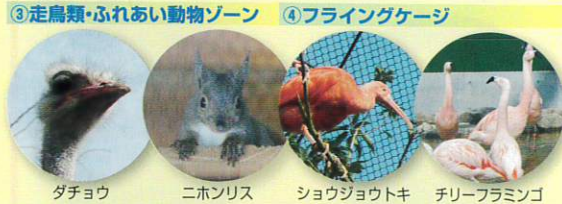
③走鳥類・ふれあい動物ゾーン ④フライングケージ ダチョウ ニホンリス ショウジョウトキ チリーフラミンゴ