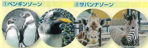
①ペンギンゾーン ②サバンナゾーン フンボルトペンギン ジェンツーペンギン アミメキリン ハートマンヤマシマウマ