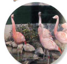
チリーフラミンゴ