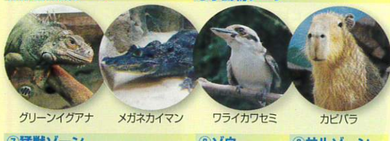
⑤は虫類館ゾーン ⑥小動物ゾーン グリーンイグアナ メガネカイマン フライカワセミ カピバラ