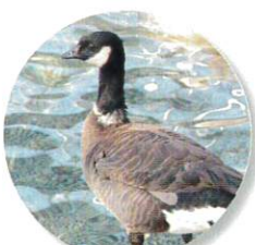
シジュウカラガン