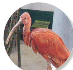
ショウジョウトキ