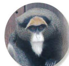
ブラッサモンキー